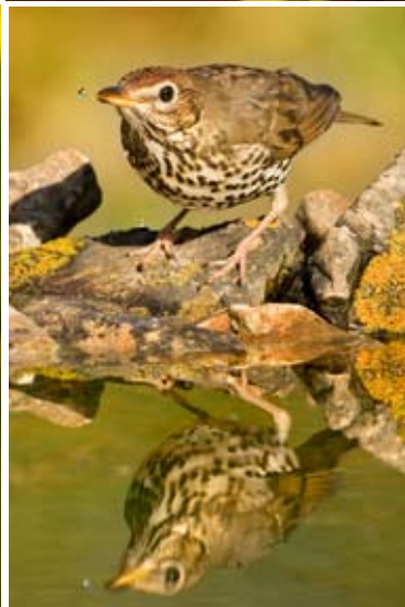
Flora i fauna de Menorca: 22 fotografies + instal·lació