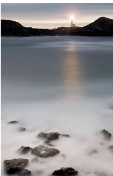
Paisatge de Menorca: 21 fotografies