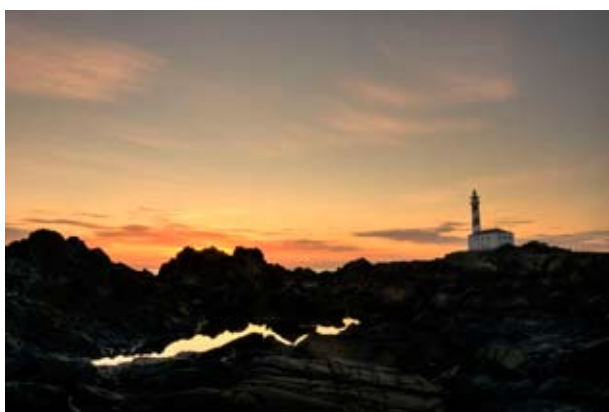
Arquitectura: 20 fotografies